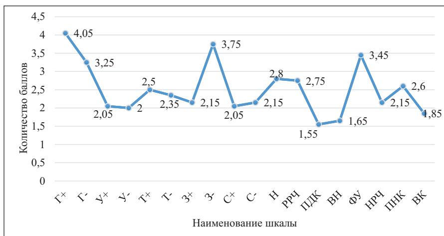
Рис. 1. Стили родительского воспитания студентов училища

Из общего количества испытуемых стиль родительского воспитания