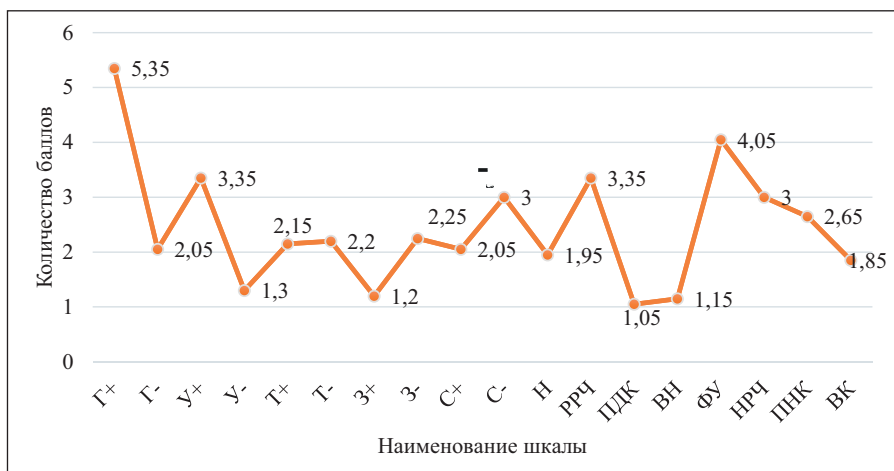
Рис. 2. Стили родительского воспитания студентов института Fig. 2. Parenting styles of the institution students

«Доминирующая гиперпротекция» в группе студентов училища характерен для 40 % испытуемых, а в группе студентов института – 55 %. По интегративной шкале «Гипопротекция» в группе испытуемых студентов училища оказалось 65 % человек, а в группе студентов вуза – 35 %.