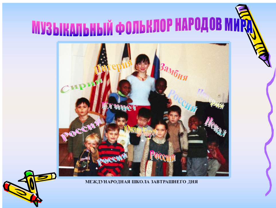
Фото 1. Титульный лист авторского электронного ресурса Т. И. Баркаловой