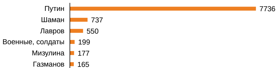
Рис. 2. Распределение ответов респондентов на открытый вопрос: «Кого из известных ныне живущих людей Вы бы могли назвать “символом современной России”?»

Второй по популярности личностью стал певец Шаман (Ярослав Дронов). Среди наиболее частых упоминаемых имён присутствует также Олег Газманов. Это показывает большую значимость представителей современного музыкального искусства для ассоциативного ряда образов России (рисунок 2).